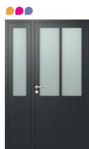
1 VANTAIL + SEMI-FIXE INCAS