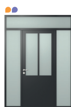
1 VANTAIL + DOUBLE FIXE EN DORMANT + IMPOSTE VITRÉE