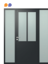
1 VANTAIL + DOUBLE FIXE EN DORMANT