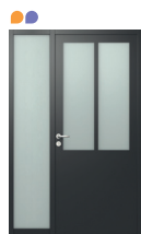
1 VANTAIL + FIXE EN DORMANT